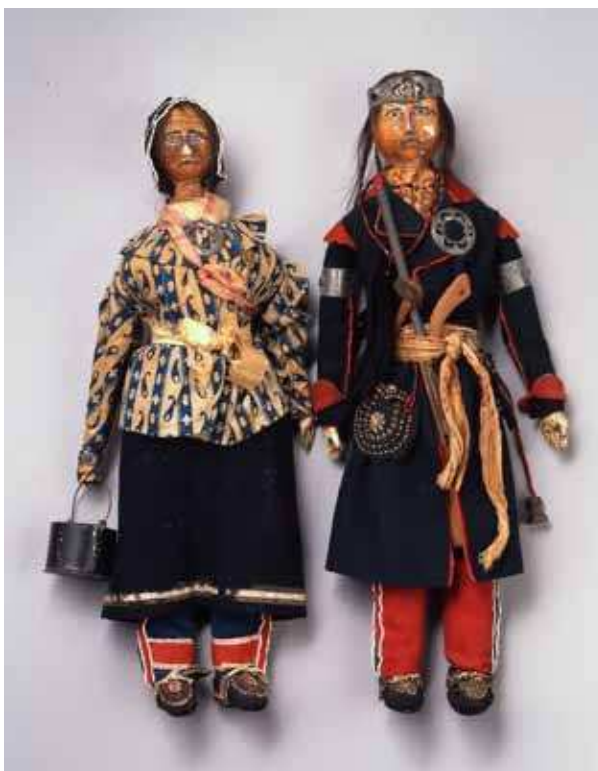
The Elizabeth Cole Butler Collection.

“Lorette-Huron Female Doll”, ca. 1830-1850. Portland Art Museum, 88.43.6. “Lorette-Huron Male Doll”, ca. 1830-1850. Portland Art Museum, 88.43.7.