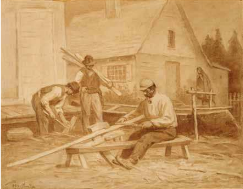
FIGURE 4 Hurons fabriquant un canot. Dessin de Charles Huot, craie sur papier, 1897.

Collection du MNBAQ, N.34.206.