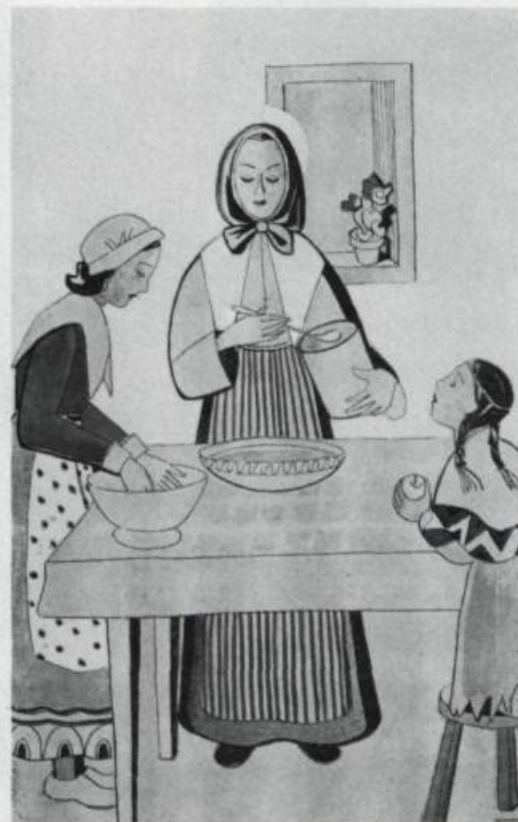
Marguerite Bourgeoys (1620-1700). «Éducatrice incomparable, elle inspira une telle tradition d'urbanité et de savoir-vivre à ses religieuses qu'on leur reconnaît encore aujourd'hui le titre de Dames de la Congrégation». Illustration tirée de La cuisine raisonnée , 1961.